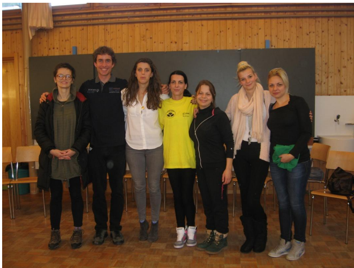
Nakon ulaska u kuću ručali smo i krenuli na prvu radionicu pod nazivom „Predstavljanje Dečjeg sela“. Na ovoj radionici smo se međusobno upoznali sa decom iz Sokobanje, Užica, supervizorima i voditeljima.